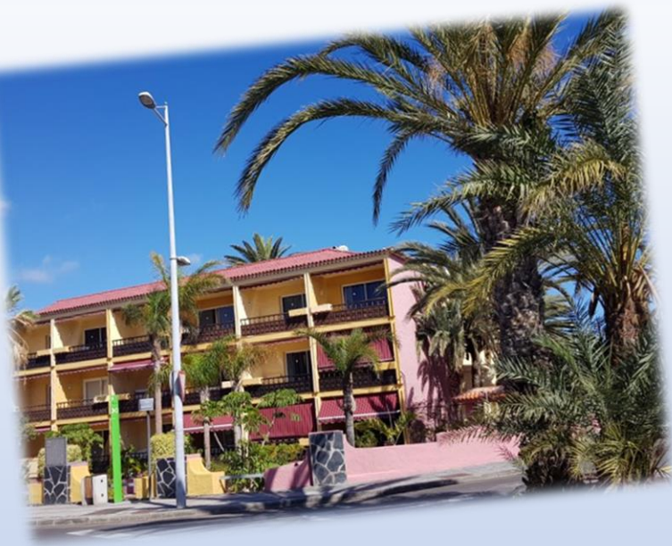
Unser Appartement-Hotel an der Costa del Silencio