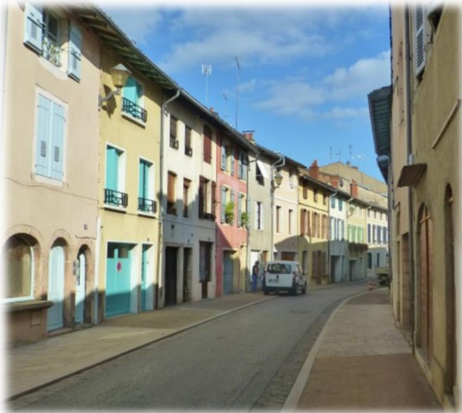
Malerische, enge Gässchen in der Altstadt