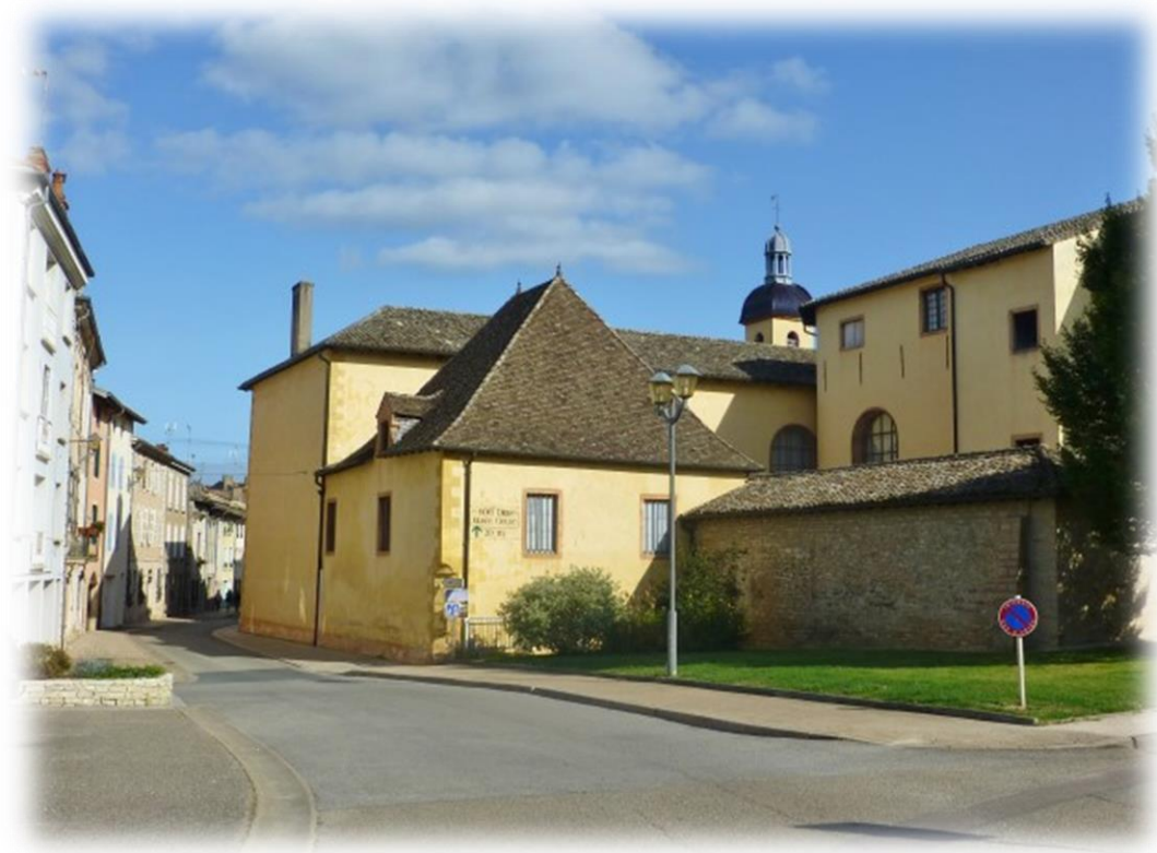
Hotel Dieu und Museum Greuze