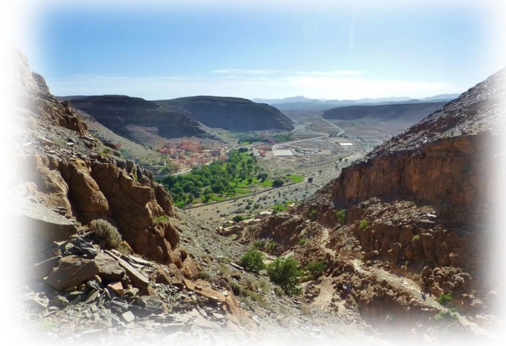
Ausblick hinunter ins Dorf Amtoudi sowie in die Umgebung