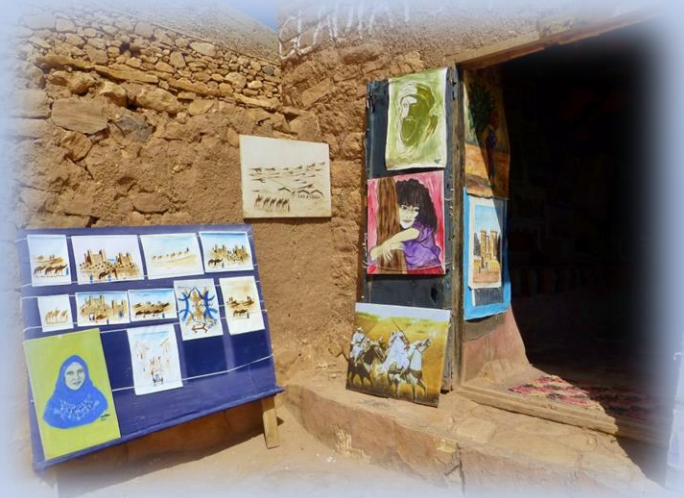
Die Werkstatt eines Künstlers, der noch im Ksar wohnt und arbeitet.

Seine mit einer ganz speziellen Maltechnik erstellten Bilder über einer Gasflamme faszinierten uns derart, dass wir ihm eines als bleibende Erinnerung abkauften.