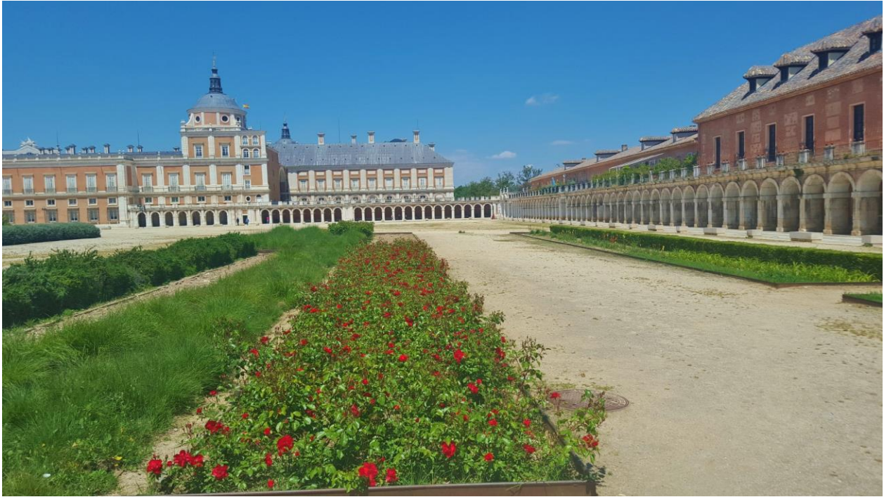
San Antonio-Kirche (mit großer Kuppel und ionischen Säulen)