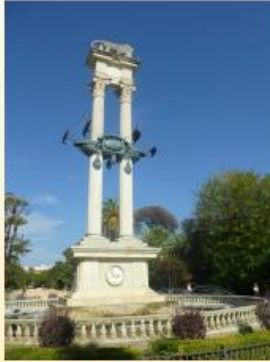
Chr. Kolumbus Denkmal